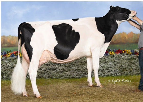
SCIENTIFIC DECADENT RAE THIRD DAM