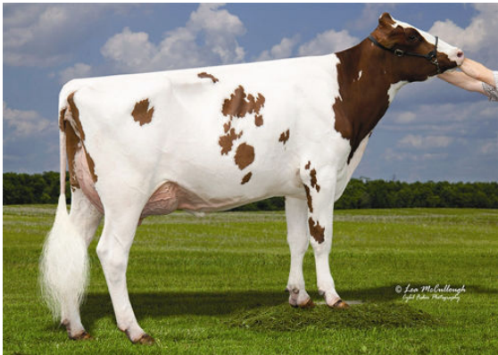
SCIENTIFIC DUSTY RAY-RED GRANDDAM