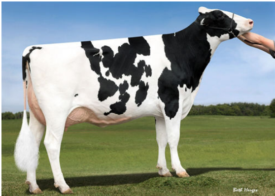
SCIENTIFIC D CAMBRIA RAE DAM